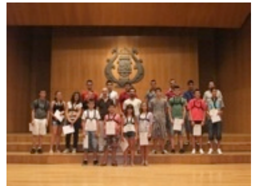
Participants curs de saxofon