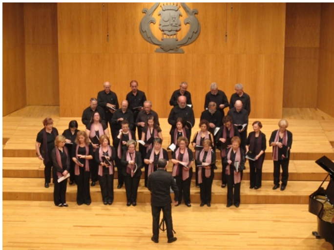
Orfeó Polifonic de Massanassa