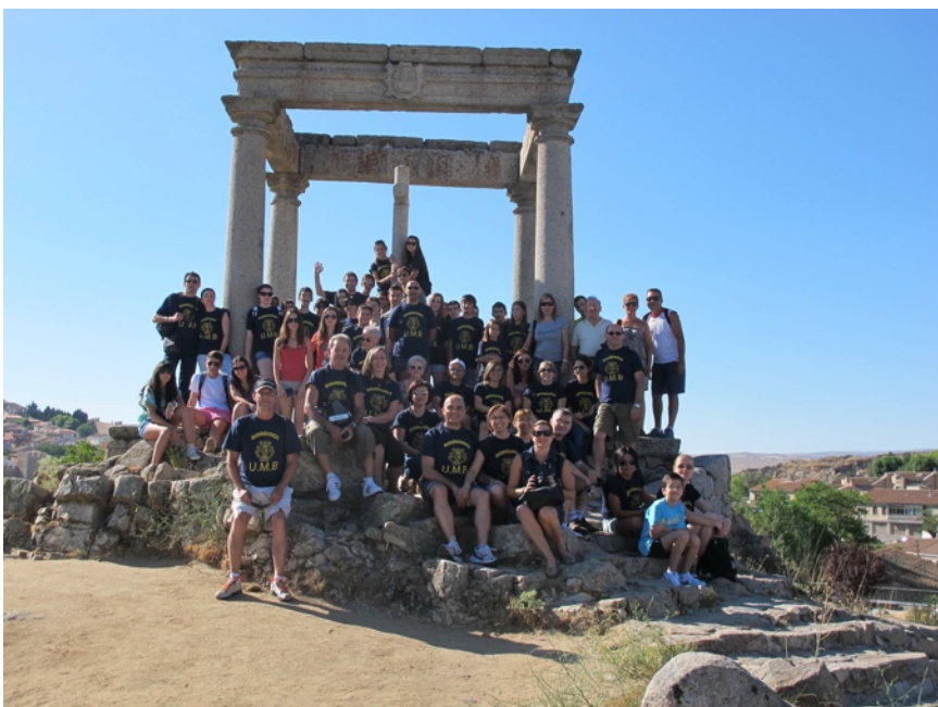
Músics i acompanyants al monument religiós "Los Cuatro Postes"

Per tot açò vos esperem a la següent expedició. FINS L'ALTRA.