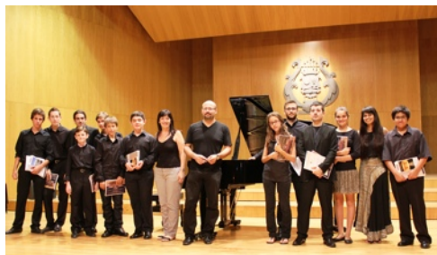
Participants curs de piano