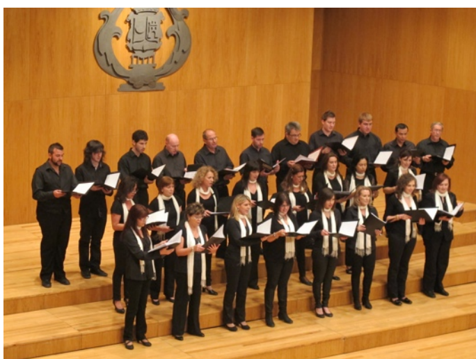
Grup Polifònic UMB

Després poguérem fruit del cant comú amb els tres cors baix la direcció de Pablo Gimeno: Blue Moon de R. Rodgers amb la lletra en Valencià. Es pot gaudir de la gravació del concert i del seu programa en el blog de la pàgina web de la Unió Musical de Benaguasil http://www.umbenaguasil.es