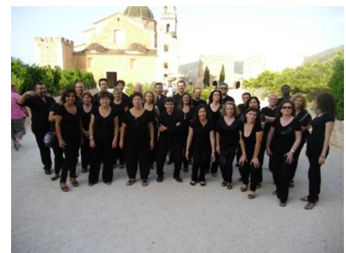
Membres del Grup Polifònic a Santa Maria de la Valldigna