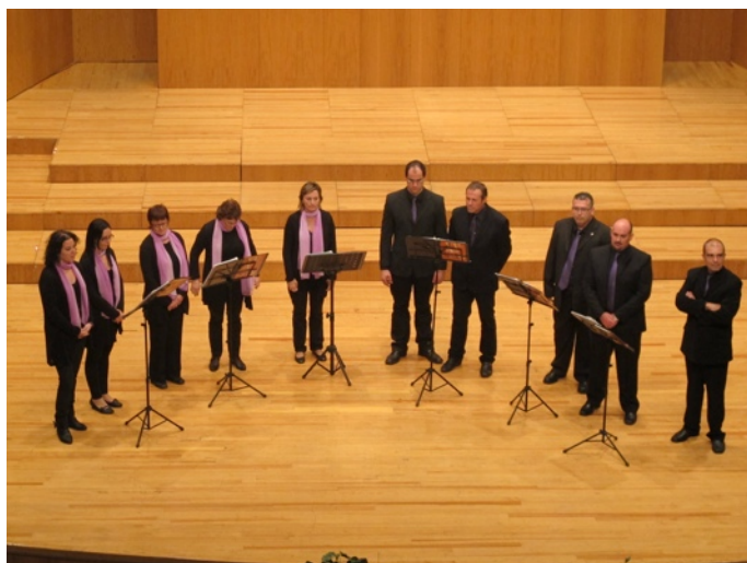
Cor de Cambra 15 de Març

El Grup Polifònic de la Unió Musical de Benaguasil ens va proposar un viatge a través del temps, de l'amor i, amb l'ajuda d'un narrador, contar-nos un conte. En primer lloc anem al segle XVI, al renaixement: Amor que tens ma vida, pavana anònima on veurem l'amor cortés. Després anem a principis del segle XVIII, al barroc: Jesu, meine Freude! de J.S. Bach on veurem l'amor a Déu. A continuació anem a finals del citat segle, al classicisme: Se lontan, ben mio, tu sei! de W.A. Mozart on veurem que l'amor en eixa època és més galant. I precursor del romanticisme més idealitzat, que és la següent estació d'este viatge: Nun, inr Musen, genug! de J. Bramhs, a mitjan segle XIX. I per fi apleguem al segle xx. Amb la passió: