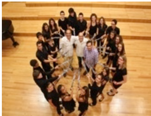
Participants curs d'oboè