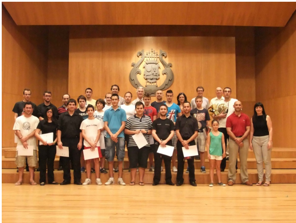
Participants del I concurs internacional de Trompa “Vicente Zarzo”

“la trompa és l'ànima de l'orquestra”. Robert Schumann